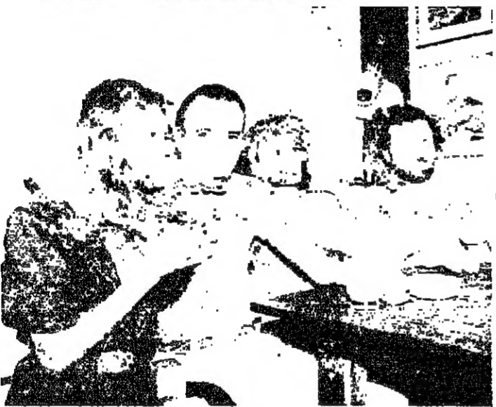
المغني الاسباني خوليو قام اخيرا بجولة حول العالم قادتته الى تاهيتي حيث اضفى اجازة هادئة نغم فيها بالحسن والاناس والسهرات الاصيلة كما يبدو في الصورتين